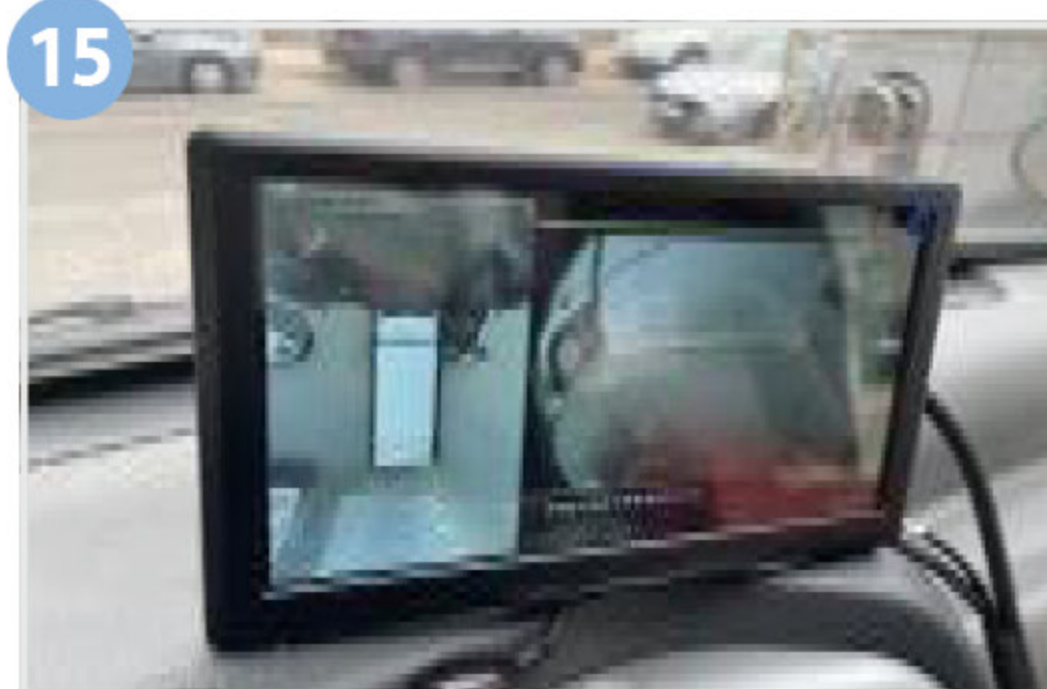
15 화물자동차 충돌재해예방설비 (후방카메라, 인체감지센서)