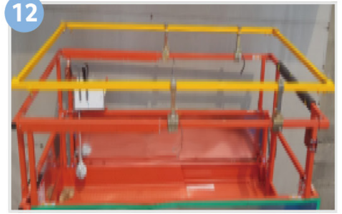
12 시저형 고소작업대 과상승 방호장치 (안전바, 안전봉(코너설치형))