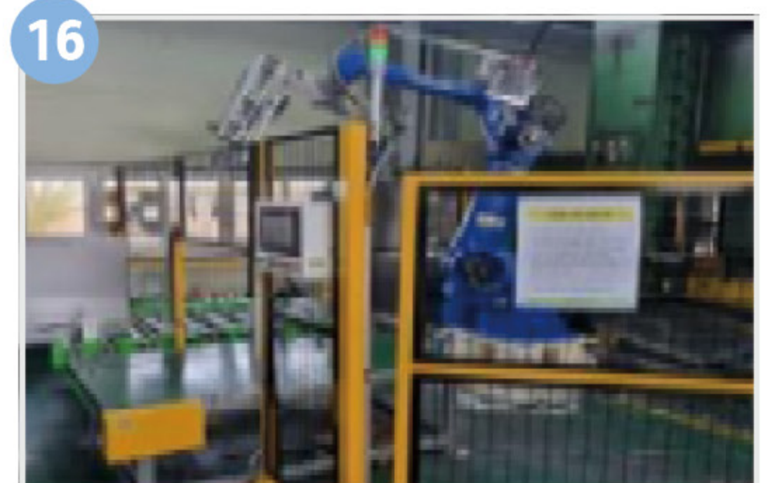
16 고위험작업 대체설비(자동화설비)