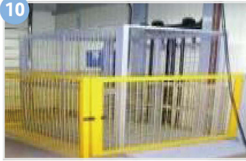
10 리프트·승강기 안전장치 (방호울, 과부하방지장치 등)