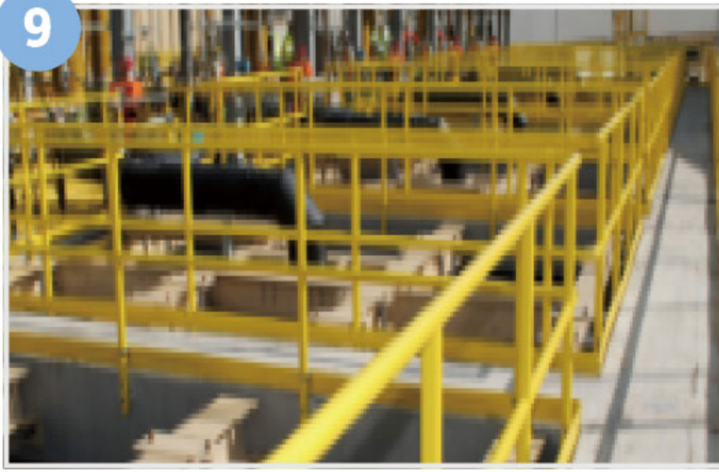
9 추락방지시설 (안전난간, 방책, 개구부덮개, 이동식 사다리 등)