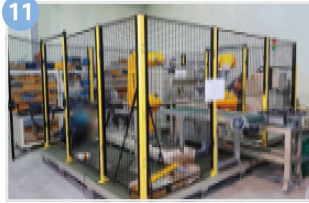
11 산업용 로봇 방호장치 (방호울, 라이트커튼, 안전매트 등)