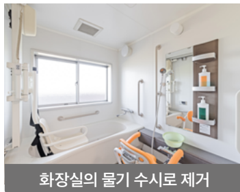
화장실의 물기 수시로 제거