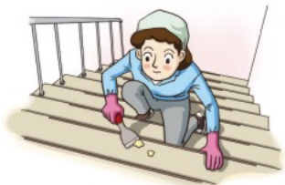
계단의 상향으로 이동하며 청소