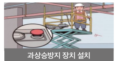
과상승방지 장치 설치