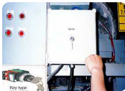
기동장치 잠금장치 (Key 타입 스위치)