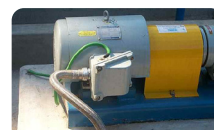
구동모터 외함 접지