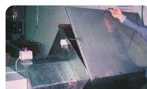
덮개 연동(Interlock)장치 설치