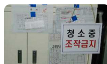
정비, 수리 중 조작·사용금지 표지판 부착