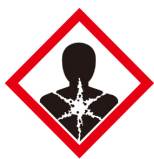
발암성·변이원성·생식독성· 전신독성·호흡기 과민성 물질 경고