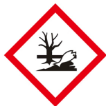
수생환경 유해성 경고