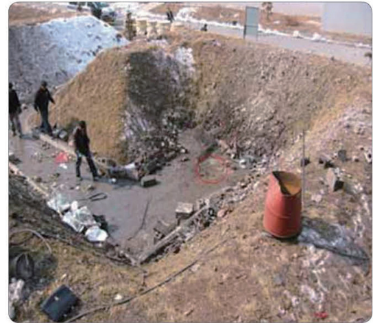
Lokasi Terjadinya Kecelakaan Ledakan