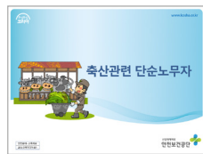
축산관련 단순노무자 교안(PPT)