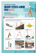
올바른 안전대 사용을 위한 ABC(OPS)