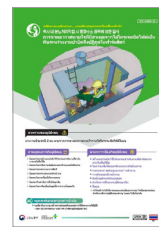
축사 내 분뇨처리 작업 시 황화수소 중독에 의한 질식(OPS) ※외국인용 포함