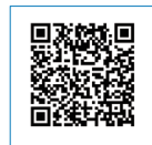
이수자 조회 바로가기