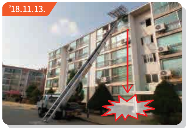
▶ 경기도 시흥시