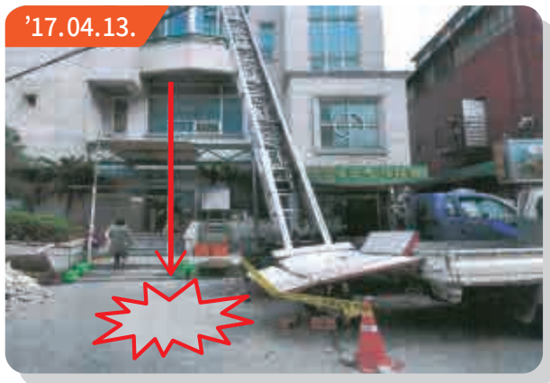
▶ 경기도 안양시