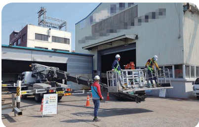
▶ 고소작업차(스카이) 임차료