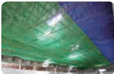
▶ 추락방지망 구입·설치비