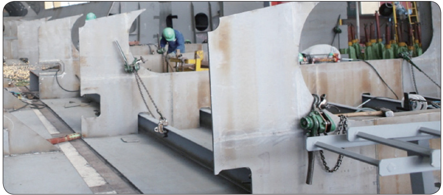
레버풀러를 이용한 작업