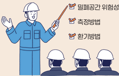
밀폐공간 안전수칙 교육