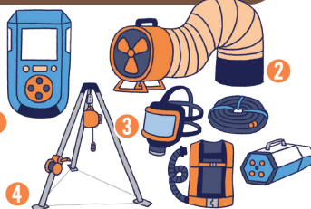
장비대여 및 사용방법 교육