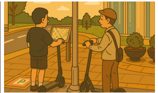
개인형 이동수단 이용중 사고