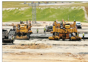
콘크리트 살포기 및 콘크리트 피니셔 조합작업