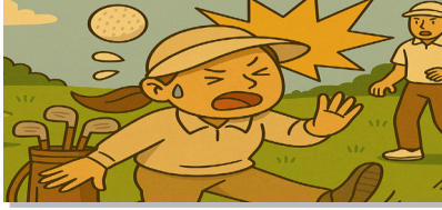
골프 플레이 중 날아오는 타구에 맞음