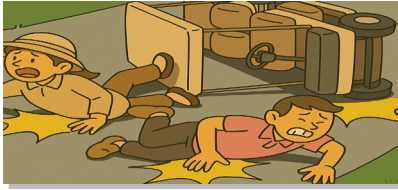
내리막 커브 길을 내려오던 골프카트에서 넘어짐