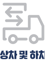
상차 및 하차