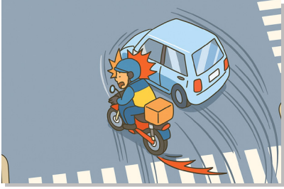
신호를 위반하여 직진하던 중 좌회전 차량과 부딪힘