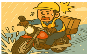
빗길, 눈길에 미끄러짐