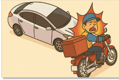
음주운전, 교통법규 위반 차량과 충돌