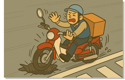
주행 중 도로 패인 부분에 걸려 이륜자동차와 함께 넘어짐