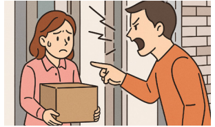
고객의 폭언 등