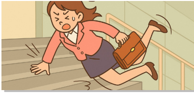
제품 배달 중 건물 계단에서 발을 헛디더 넘어짐