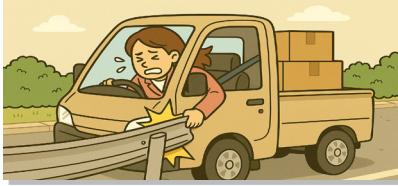
방문장소 차량이동 중 가드레일 부딪힘