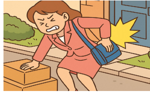
요통 등 근골격계질환