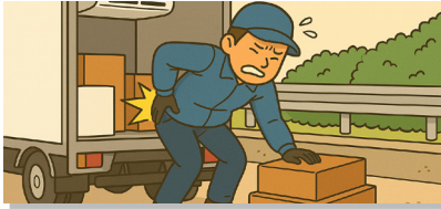
배달제품을 차량에서 허리를 굽혀 꺼내다가 허리 통증