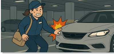
주차장 내 도보 이동 시 차량과 충돌