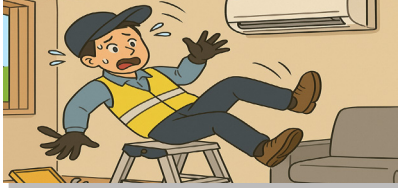
제품 상부 서비스 점검 중 발판(의자 등)에서 떨어짐