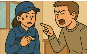
고객의 폭언 등