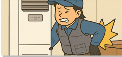
하부 청소를 위해 제품 이동 중 근골격계질환 발생