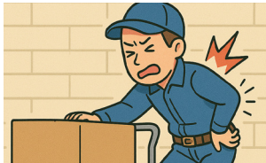
요통 등 근골격계질환