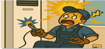
활선상태의 전선을 가위로 절단작업 중 감전