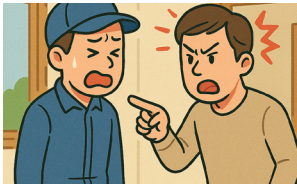
고객의 폭언 등