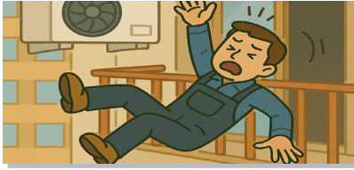
에어컨 실외기 설치·수리 및 점검 시 추락