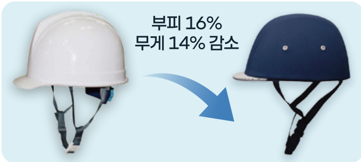
일반 안전모 평균 무게 290g