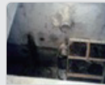
Instalasaun fatin tratamentu fo'er kalan nian