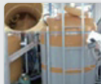
Armazenamentu matéria-prima sira