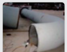
Iha kanu solda nia laran