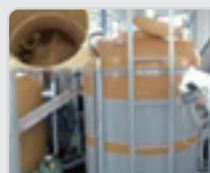
Чийки зат сактоочу резервуар