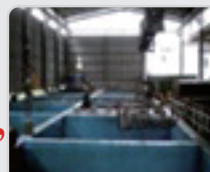
Тамак-аш ачытуу / сактоо жайы