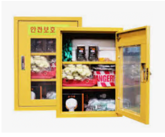
보호구 보관함을 통한 청결 관리