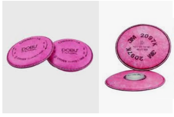
필터의 주기적 교체