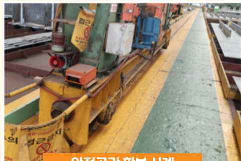
안전공간 확보 사례