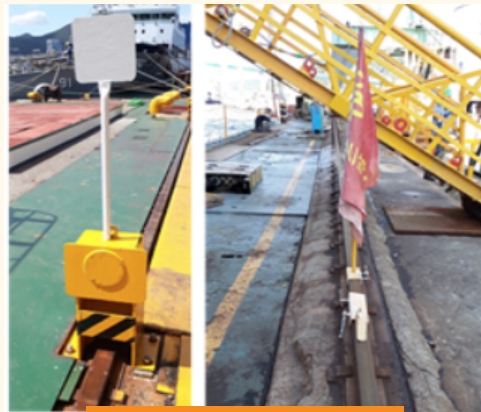
임시 스토퍼 설치 사례