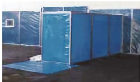
작업장과 연결되어 있는 위생설비