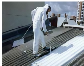
석면함유 자재 고착화