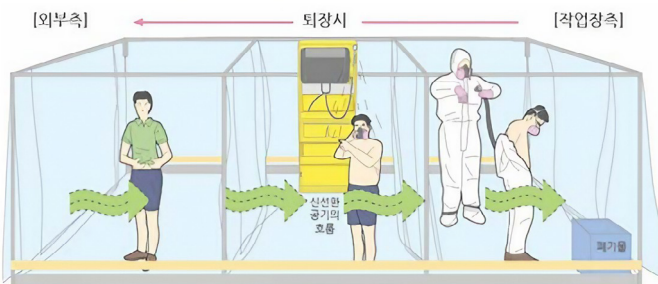
평상복 탈의실 - 샤워실 - 작업복 탈의실