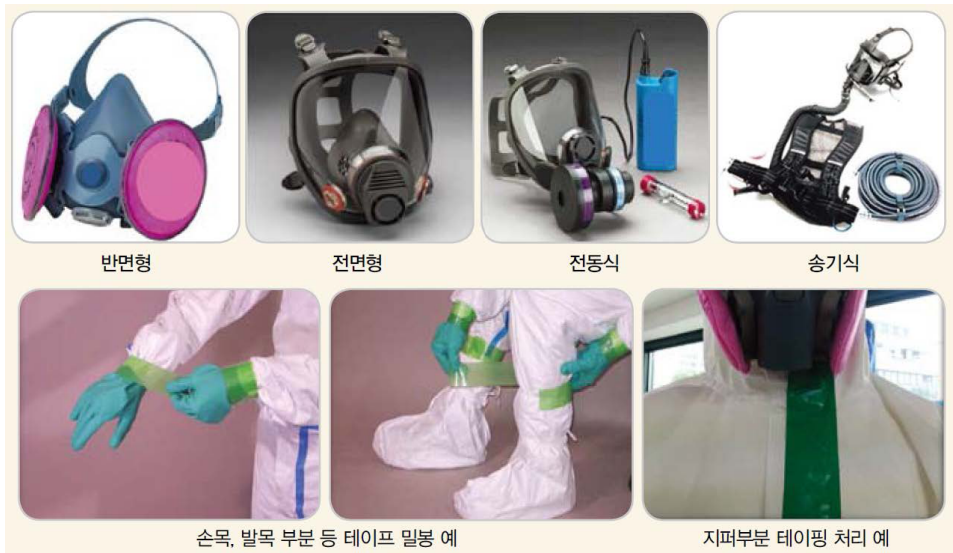
호흡용 보호구 예시