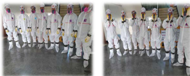
<보호구 착용 모습>