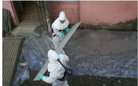
습식작업 및 해체·제거작업