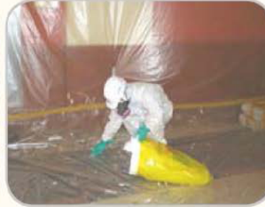
석면함유 잔재물의 청소 예