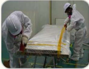
석면폐기물 포장 예