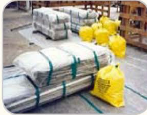
포장된 페슬레이트와 잔재물의 예