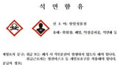
석면함유 잔재물 처리 시 표지