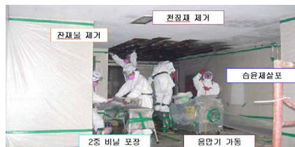
천장재 및 바닥타일