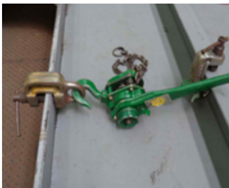
레버풀러로 부재 단차조정

주요사용장비 크레인, 레버풀러, 유압램, 산소절단기, CO 2 용접기, 해머, 에어호스 등