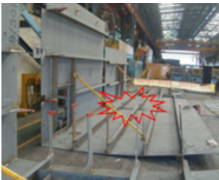
수직부재가 넘어지면서 깔림