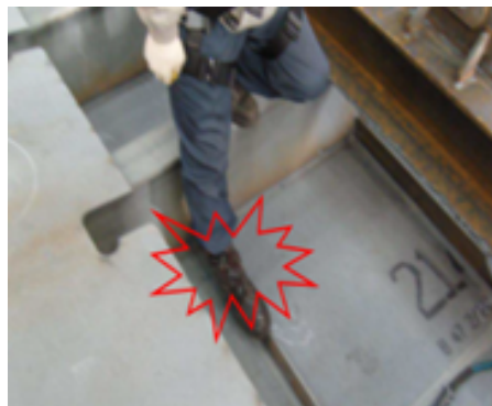
수직부재에 걸려 넘어짐