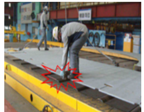
주판 사이에 신체일부 끼임