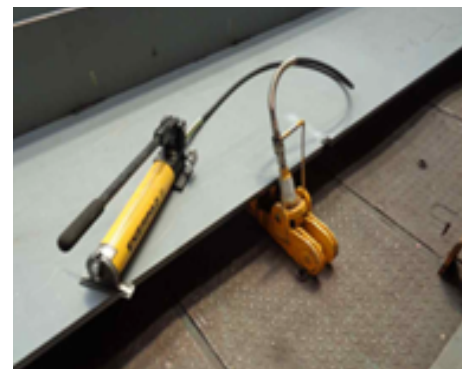
유압램으로 주판 단차 조정