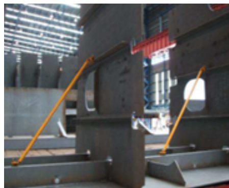
지지대 이용 수직부재 고정