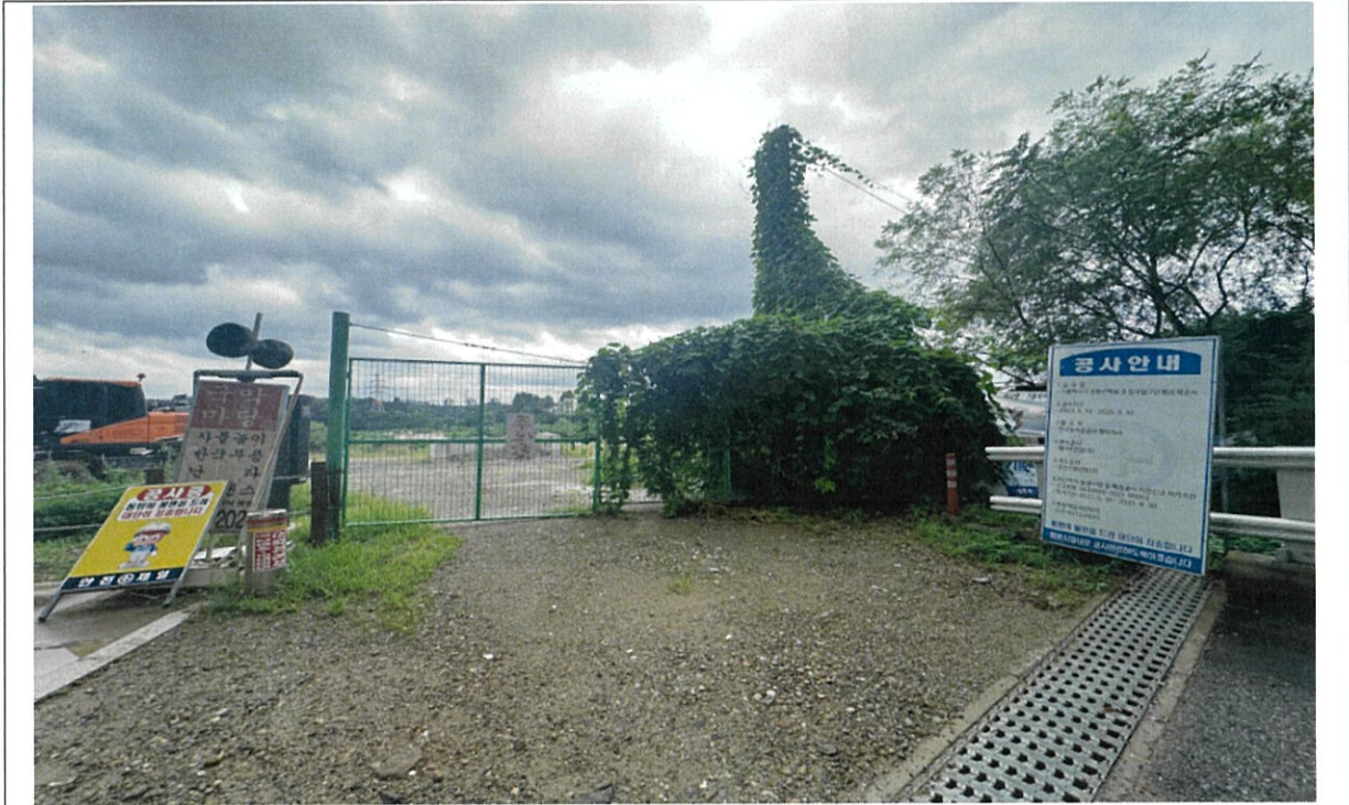
<사진1> 현재 현장 전경 사진