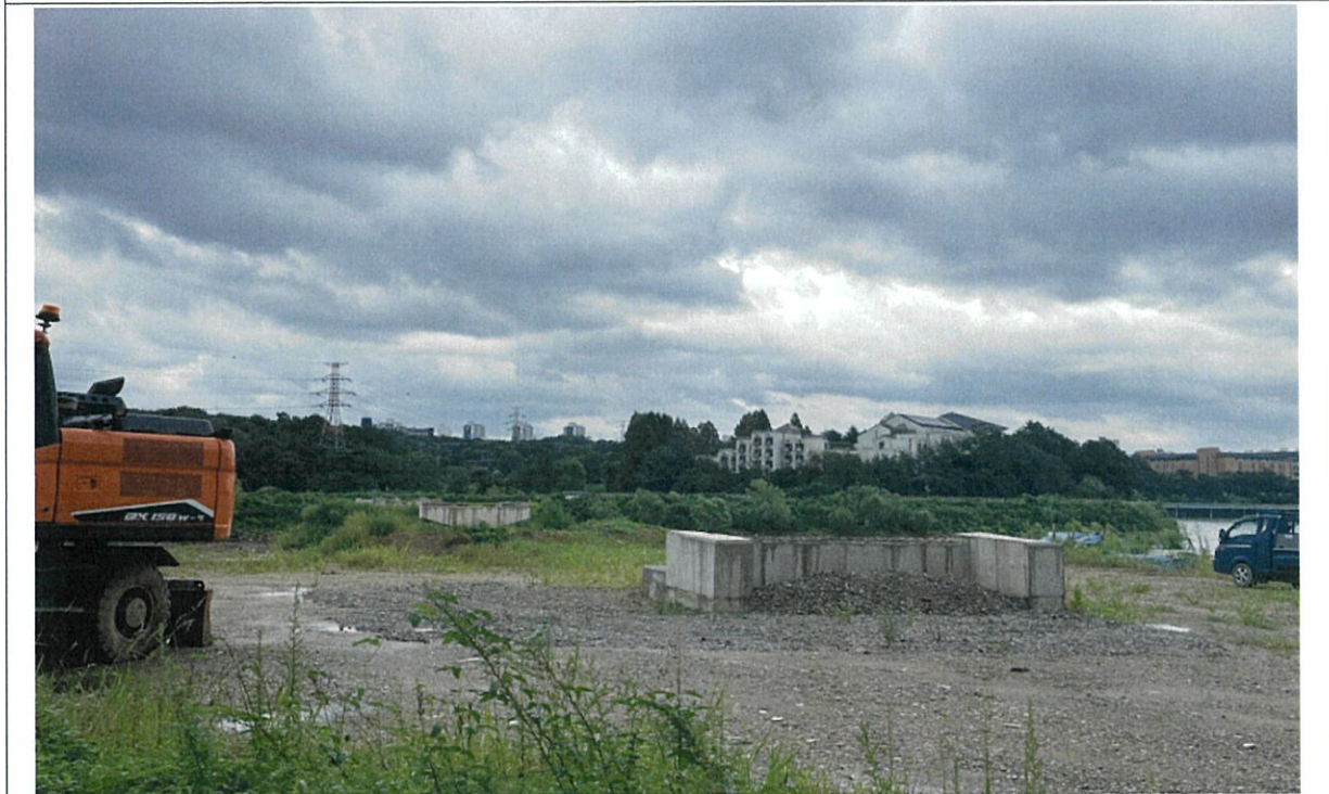
<사진2> 현재 현장 전경 사진